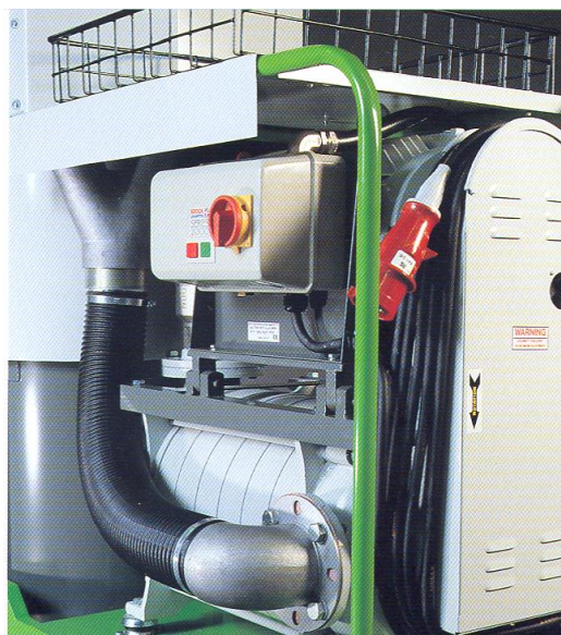
Turbine BVC centrifuge multi-étagée